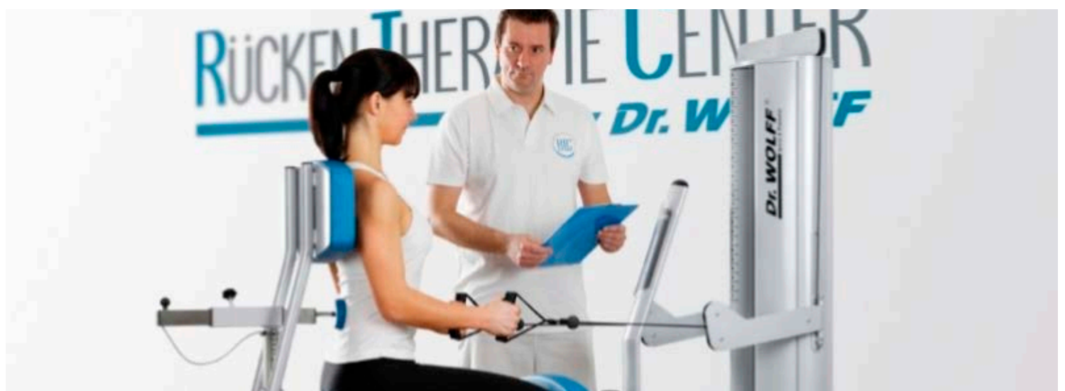
Das Rückentherapie-Center by Dr. Wolff® verfügt über spezielle Geräte, mit denen man sehr effizient trainieren kann.