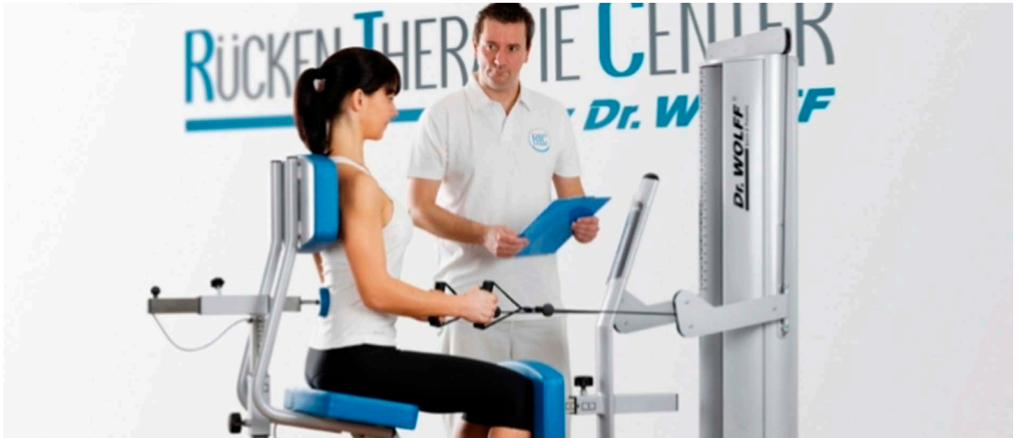
Das Rückentherapie-Center by Dr. Wolff® verfügt über spezielle Geräte, mit denen man sehr effizient trainieren kann.